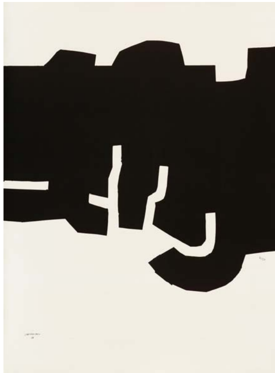
Galerie Maeght, Affiche avant n°138 , Lithographie originale, 160 x 117,5 cm, 1973, 50 exemplaires