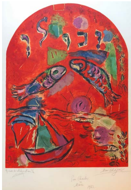
Bouquinerie de l'Institut, Marc Chagall, épreuve pour "Vitrail pour Jérusalem"