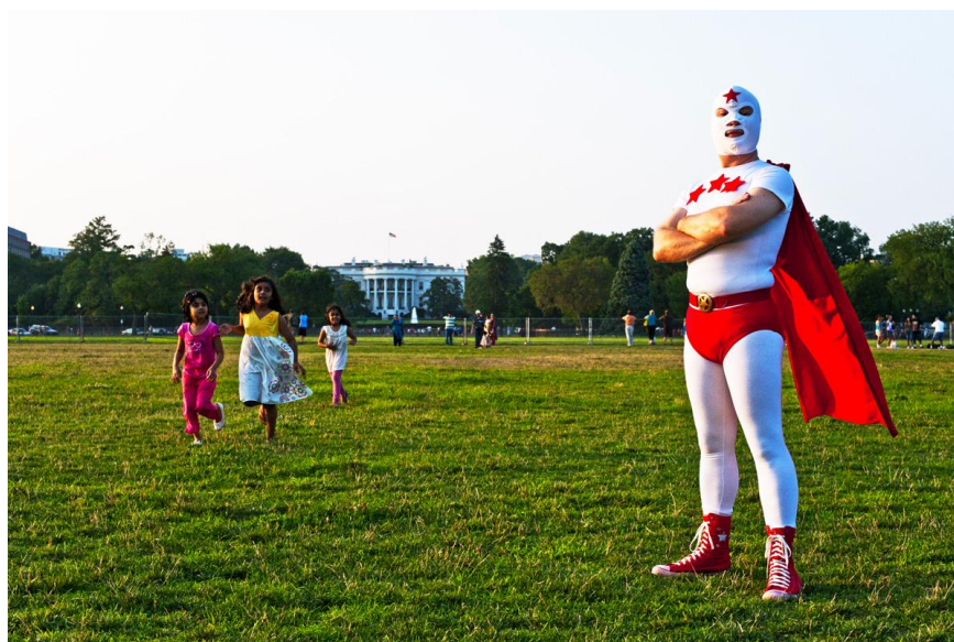
Captain Prospect, un des Real Life Super Heroes (RLSH) de Pierre-Elie de Pibrac présentés en NFTs

En complément de cette exposition NFTs, Achetez de l'Art participe à la CADAF online (Crypto and Digital Art Fair) du 17 au 23 juin avec les 1ers NFTs du photographe Pierre-Elie de Pibrac, issus de sa série Real Life Super Heroes.